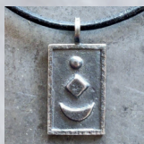
OVAL/ECKIG IN SILBER, (WEISS ODER GESCHWÄRZT), 63,00 €